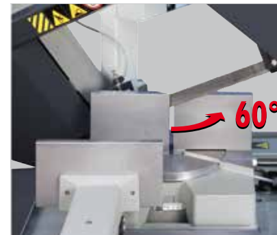
PH 262 - PH62HB